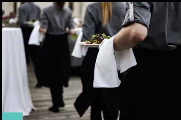
2 Fotografija dogodkov