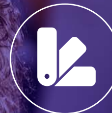
Celostna grafična podoba