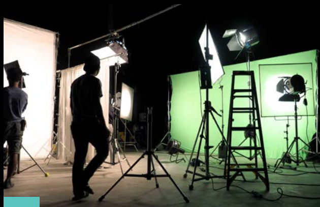
4 Promocijski ali produktni video