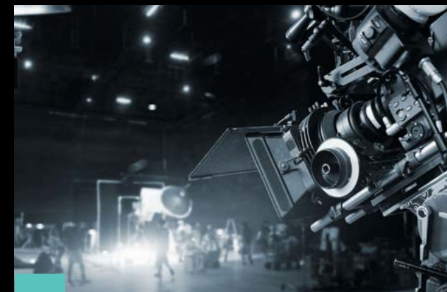
3 Spletni in TV oglasi