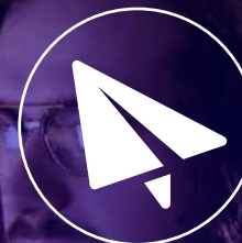
Oblikovanje promocijskih materialov