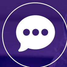
Oblikovanje komunikacijskih materialov