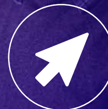
Oblikovanje spletnih strani