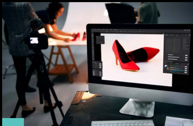
1 Produktna, promocijska fotografija